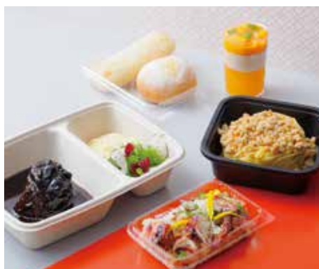
ラベデュータ・アット・ホーム 〜トスカーナ・シグニチャー〜 (1名様分)