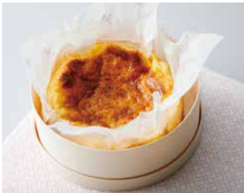
リコッタチーズケーキ