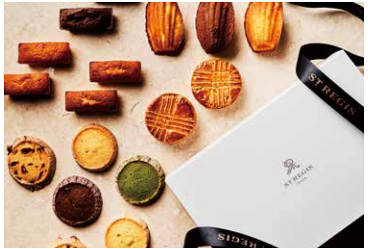
セントレジス ホテル 大阪 オリジナルGift Box

手土産や贈り物にぴったりのギフトボックスです。お好きな商品を自由に組み合わせて、あなただけのオリジナルギフトセットもお作りいたします。