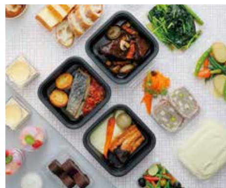
クレイジー・ビストロ (2名様分)