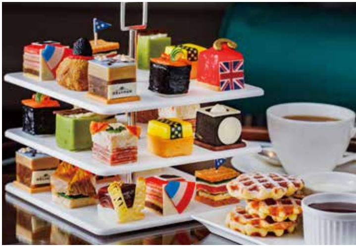
St. Regis Afternoon Tea to Go! with Delvaux (2名様分) 【期間限定】～2021年12月31日(金)