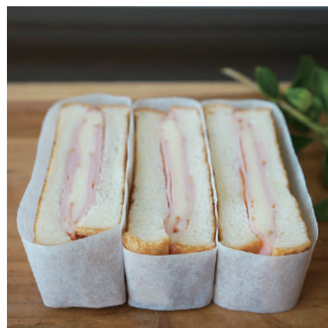
6. 【商品名】クロック・ムッシュ 【価格】¥900 (税別) ハム、チーズ