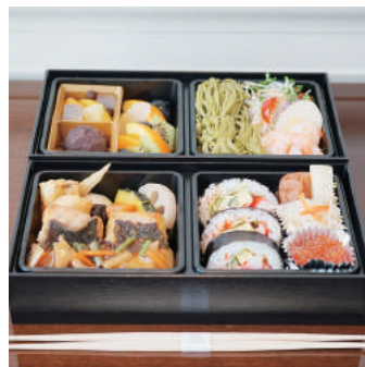
12. 【商品名】特製弁当 (魚) 【価格】¥2,500 (税別) スズキの野菜餡かけソース 小海老の茶蕎麦サラダ 蟹のロール寿司 和風デザートとフルーツ