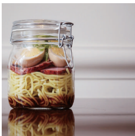
1. 【商品名】醤油ラーメン 【価格】¥1,800 (税別) 焼豚、メンマ、煮卵、葱、鶏ガラ醤油 ※お湯を注ぐだけでスープが完成します。

セントレジス ホテル 大阪のエッセンスが詰まった、特別なテイクアウトメニューを、ご自宅でもお気軽にお楽しみください。