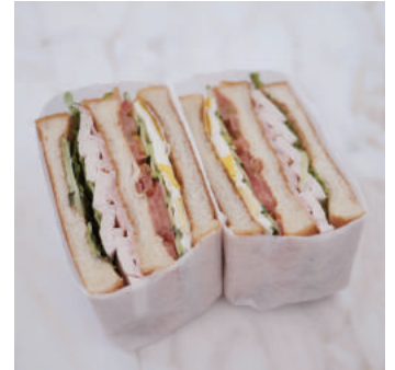
10. 【商品名】クラシック・クラブハウスサンド 【価格】¥1,400 (税別) チキン、ベーコン、エッグ、トマト、レタス