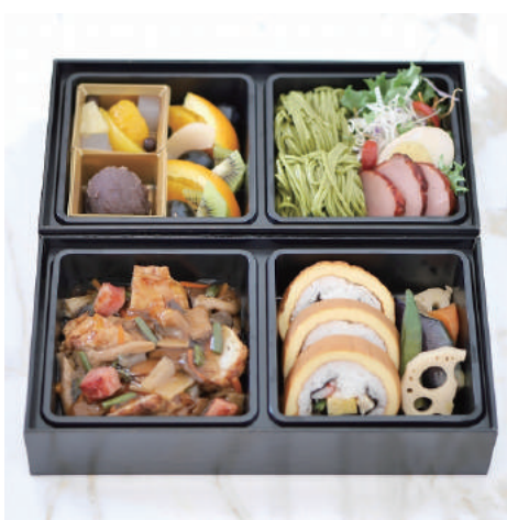
2. 【商品名】特製弁当(鶏) 【価格】¥2,500 (税別) 鶏肉の野菜館かけソース / 焼豚茶蕎麦サラダ 野菜のロール寿司 / 和風デザートとフルーツ