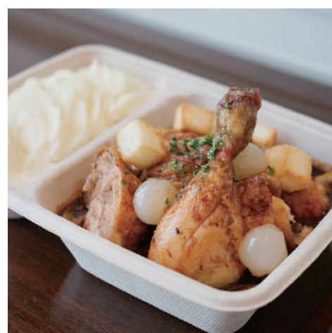
3. 【商品名】鶏肉の赤ワインソース 【価格】¥2,100 (税別) マッシュポテト、マッシュルーム、オニオン、クルトン ハーブ