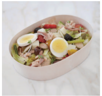
14. 【商品名】ニース風サラダ 【価格】¥1,800 (税別) ツナ、アンチョビ、ボイルドエッグ、 インゲン豆、レタス、オリーブ