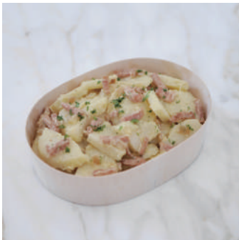
11. 【商品名】ジャーマンポテト 【価格】¥1,200 (税別) ベーコン、オニオン、パセリ マスタード・ピネグレット