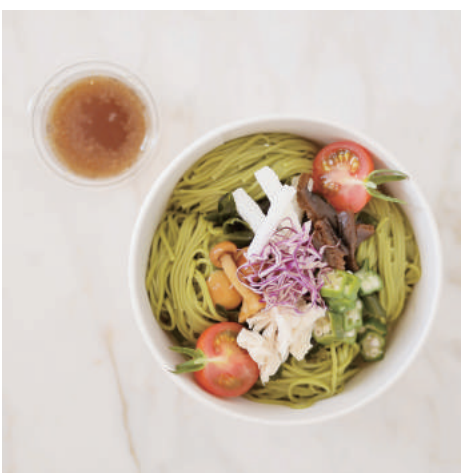
5. 【商品名】茶蕎麦 【価格】¥1,800 (税別) 椎茸、蒸し鶏、野菜、ワカメ、トマト、そばつゆ