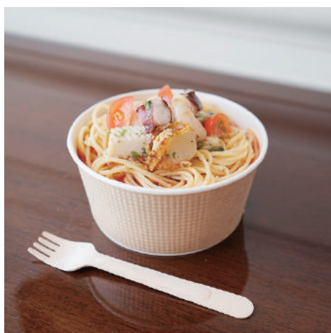
4. 【商品名】スパゲッティベスカトール 【価格】¥2,100 (税別) トマトソース、エビ、イカ、タコ、ホタテ、アサリ、 パルメザンチーズ、ハーブ