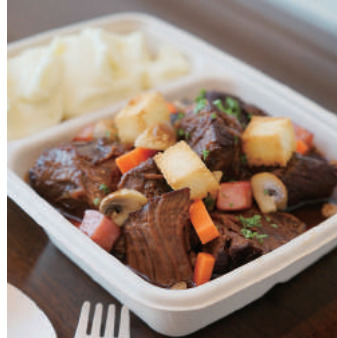
9. 【商品名】牛肉の赤ワイン煮 【価格】¥2,500 (税別) マッシュポテト、人参、マッシュルーム、 ベーコン、クルトン、ハーブ