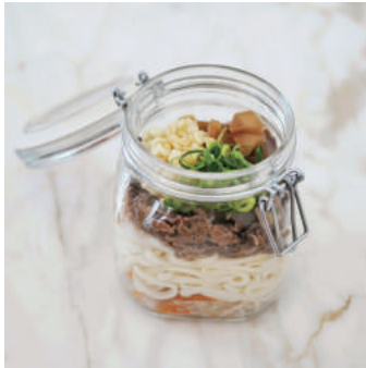
7. 【商品名】和牛肉うどん 【価格】¥2,300 (税別) 椎茸、葱、切干大根、カツオ出汁 ※お湯を注ぐだけでスープが完成します。

※ お支払いは、事前 WEB 予約時あるいはお受取り当日店頭にて、クレジットカードまたは現金にて承ります。