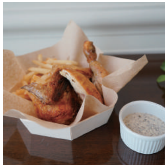
13. 【商品名】ローストチキン (1/2 サイズ) 【価格】¥1,800 (税別) フレンチフライ、トリュフマヨネーズ